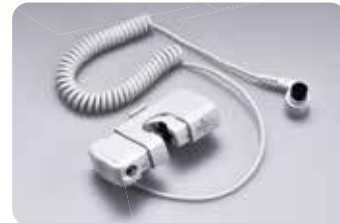
• SENSOR DE GOTEO TE-977 (OPCIONAL)