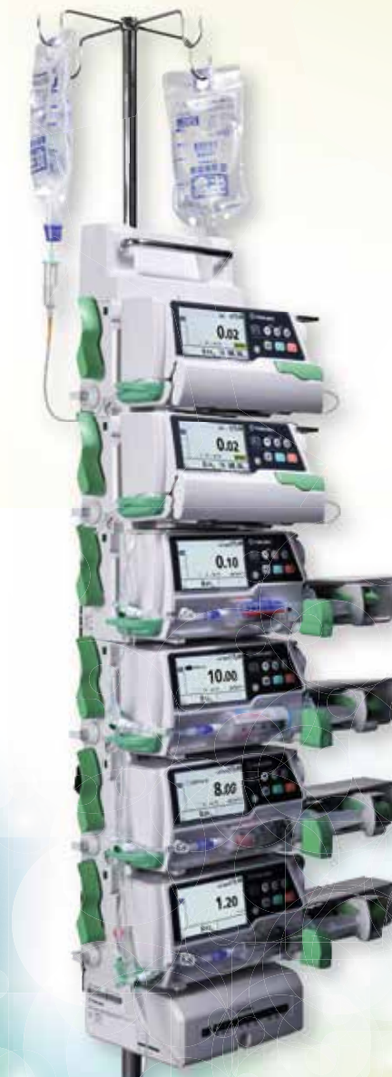
• SOFTWARE PARA BIBLIOTECA DE MEDICAMENTOS TE-SW800P SÓLO TE-LM800 (OPCIONAL)