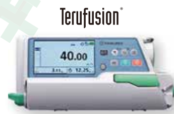
BOMBA DE INFUSIÓN TIPO LM TE-LM700 Midpress®