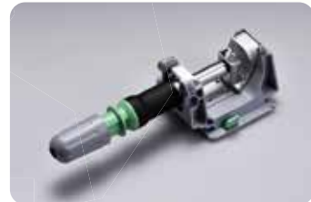
• POLE CLAMP TE-877 (OPCIONAL)