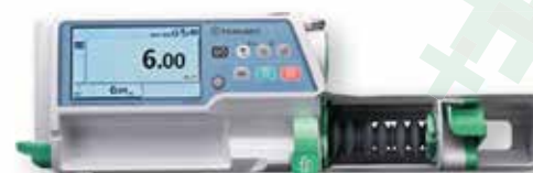
BOMBA DE JERINGA TIPO SS TE-SS700