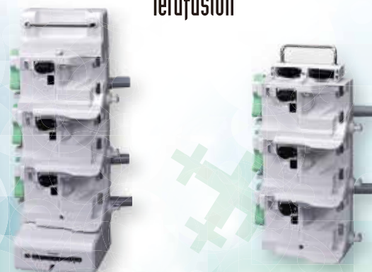
SISTEMA DE COMUNICACIÓN RACK TE-RS800 (OPCIONAL) CON FUNCIÓN DE COMUNICACIÓN TE-RS811 (OPCIONAL) SE PUEDE ACOPLAR A TE-RS800