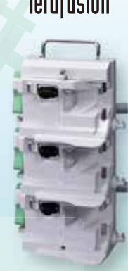
RACK STANDARD TE-RS700 (OPCIONAL) SIN FUNCIÓN DE COMUNICACIÓN