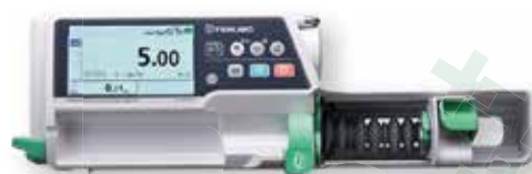
BOMBA DE JERINGA TIPO SS TE-SS800